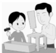
安定も良く、なかなかしっかりしてます。

◆今回の木工stूल作りでは、はじめて脚に鉄製の材料を使ってみました。天板は参加者の皆さんがそれぞれデザインを決めて製作しました。完成品はどれもスタイリッシュな出来栄でした。