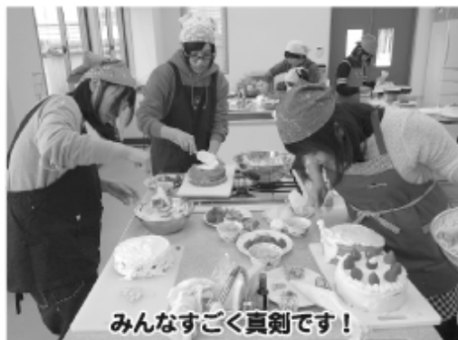
みんなすごく真剣です！

※体験講座に参加されるにあたり、親子・お孫さんとおじいちゃん・友人同士・2人1組であれば、いろいろなパターンで参加できるよう対応いたしますので、お気軽に相談下さい。次回の講座をお楽しみに！