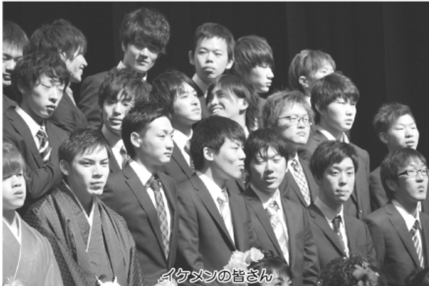
イケメンの皆さん

謝の気持ちでいっぱいです。この感謝の気持ちを忘れず持ち、自分自身がそういった存在になりたいと思っています。長期休暇があると帰省しますが、この町には美しい海・山などの自然、温暖な気候、人々の温かい心など誇れるところがたくさんあり、何年経っても私の故郷はここで、大好きな町です。こういった環