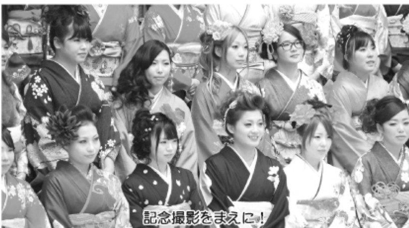
記念撮影をまえに!

げます。成人式を迎える事ができたのも、今まで私たちを支えてくださった地域の方々や先生方、家族、私たちに関わって頂いた皆様の励ましとご指導があったからです。このことを忘れず、これから社会人としての自覚を待ち、生活していきたいと思えます。 ご清聴ありがとうございます。