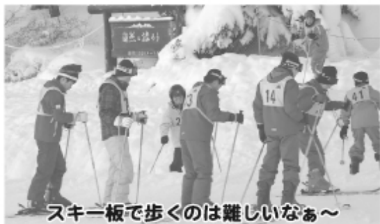
スキー板で歩くのは難しいなあ~

一番楽しかったのは、リフトを何回も乗ったことです。乗ってみたかったから乗れてうれしかったです。ご飯もおいしかったです。家に帰って五級合格したと言ったらすごくほめてくれました。スキーはすごくたのしかったです。行かせてくれてありがとうございました。幸せな日でした。