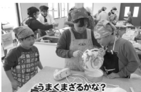
うまくまざるかな？