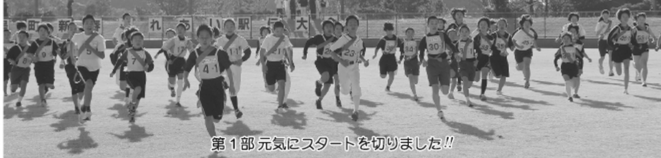
第1部 元気にスタートを切りました!!