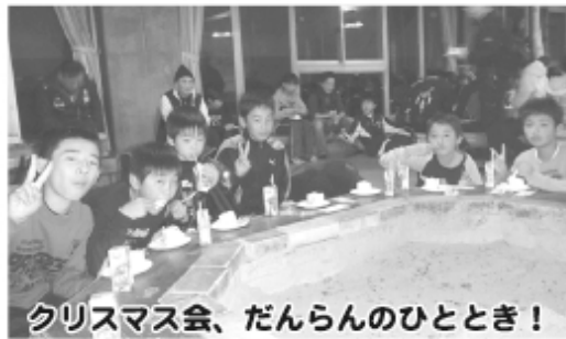
クリスマス会、だんらんのひととき!

私は、今回のスキー体験は2回目で、初日は1班としてやっていました。みんなについて行くのは難しかったけど、楽しくすべることができました。やっぱり1日目の時より急で速くすべれたのが上達したなと思いました。また、3級を合格するように、2日目は練習をしていました。大まわりがうまくでき、3日目のパッチテストは合格できました。次に行ける機会があったら2級にも挑戦してみたいです。