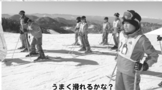
うまく滑れるかな?