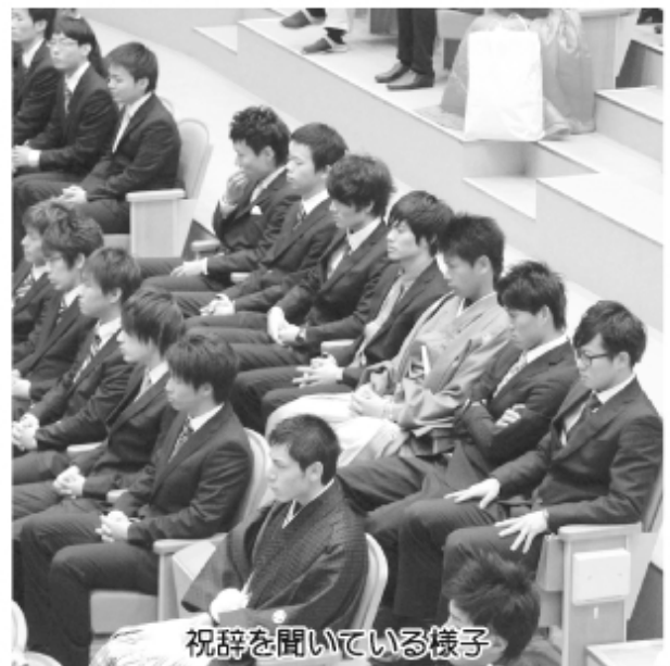
祝辞を聞いている様子

私も、自らの役割を考えなければならぬ時が来たとき身が引き締まる思いです。 私たちにはそれぞれの人生があり、未来があります。隣にいる友人と私の道は全く異なりませんが、決して優劣はありません。これから先、思い描く理想になかなか届かず、周囲の人間と生きていくにあたり、落ち込み、涙を流すこともたくさんあるでしょう。しかし、自らの人生をしっかりと踏みしめていく強い心を持ちたいです。懸命に生きるということがどれだけ大切なことか、私たちは分っています。