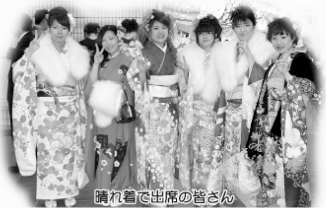
晴れ着で出席の皆さん

な盛大な式典を開催していただき、誠にありがとうございます。中学卒業までの時間を共に過ごした仲間と再会することができ、共有した懐かしい思い出が蘇ってきます。 今、この場で、一人一人が二十一年間の日々を思い出していることでしょうか。私とその日々を振り返るとき、まず思い浮かべるのは、必ずしも笑顔で満ち溢れた時間とは限りません。しかし今となっては、これまでの出来事の全てが、二十歳の自分を形作っていると受け入れることが出来ます。それと同時に、家族、友達、恩師など支えてくれた方々への感謝の気持ち溢れてきます。二十年生きたからこそ、自分がどれだけ周りの人に助けられているか、感じる事が出来るはずですよ。 この日を迎えた私たちは、二十歳の門出に胸を躍らせる一方で、それぞれが社会への関わり方を決めていかなければなりません。私はまだ学生ですが、既に職を全うしている友人も多くいます。働くことで社会を支えている友人のことを尊敬しながら