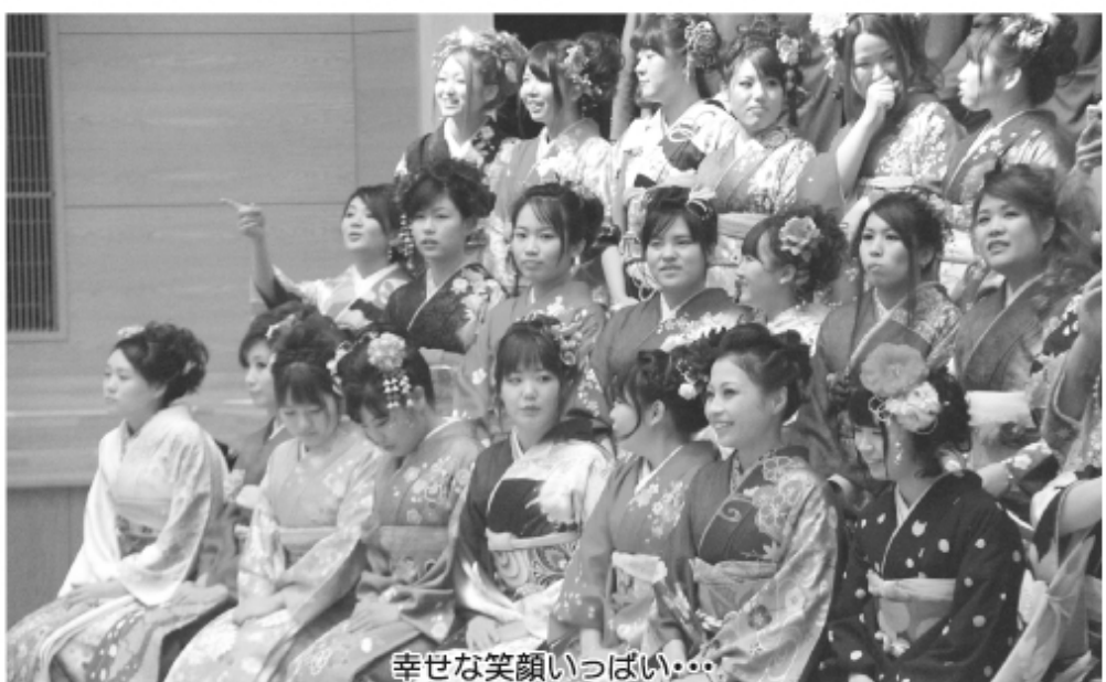
幸せな笑顔いっぱい...

この繋がりを大切にし、誰からも信頼され、周りに気を配ることのできる社会人を目標に日々元氣