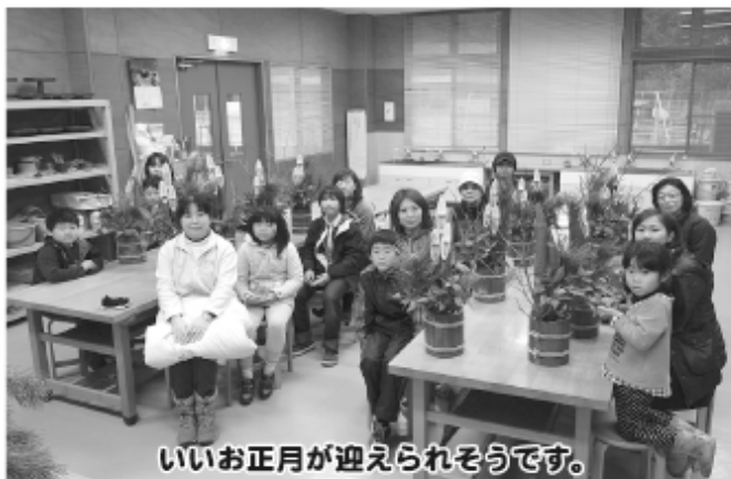
いいお正月が迎えられそうです。

※体験講座に参加されるにあたり、親子・お孫さんとおじいちゃん・友人同士・2人1組であれば、いろいろなパターンで参加できるよう対応いたしますので、お気軽に相談下さい。次回の講座をお楽しみに！