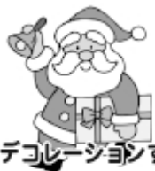
デコレーションするといい感じです。