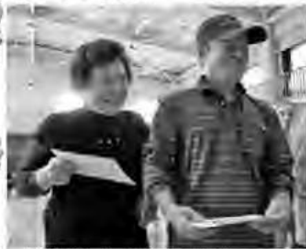
「何がもらえるんかいな〜」 笑顔がこぼれてしまいますね☆