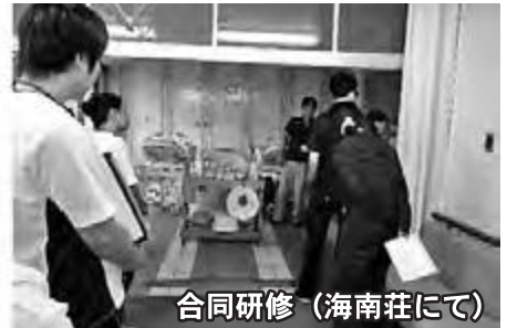
合同研修（海南荘にて）

「海陽町介護保険事業者等連絡協議会」は、高齢者の健康と福祉の増進を目的として、町内の介護事業者・社協と町が連携して取り組んでいます。