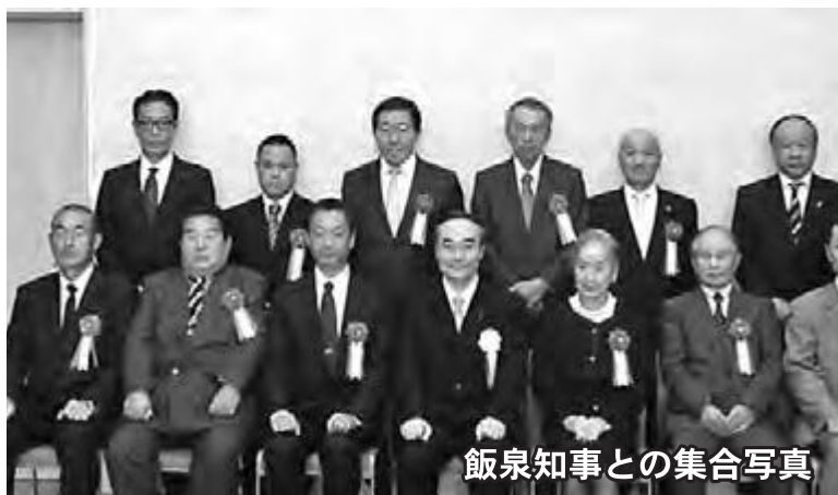
飯泉知事との集合写真

震潮記：室町時代から江戸時代に宍喰地区を襲った4回の南海地震の被害が詳細に記されており、巨大地震と津波の教訓として、防災教育に寄与しています。