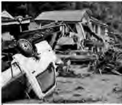
発災直後の朝倉市の様子

7月5日、九州北部を記録的な豪雨が襲い、土砂崩れや河川の氾濫などにより多くの集落が孤立し、多数の死者、行方不明者等を出す甚大な被害をもたらしました。