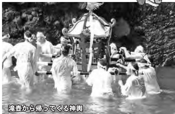
滝壺から帰ってくる神輿