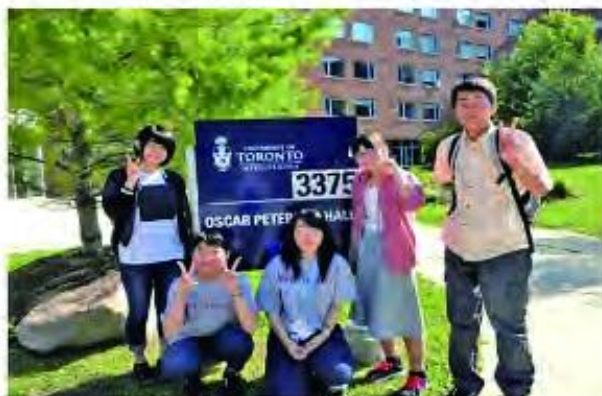
カナダ・トロント大学にて

留学したい、その気持ちを胸に海部高校へ入学しました。目標を叶えることができた自分をほめたいです。そして支えてくれた方々、応援してくれた両親、友達に感謝が尽きません。この思いを忘れず、今後の生活に活かしていきたいです。