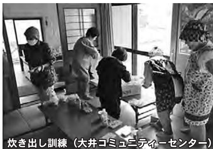
炊き出し訓練 (大井コミュニティーセンター)