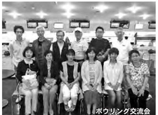
ボウリング交流会

〒775-0295 徳島県海部郡海陽町大里字上中須128番地 海陽町関西ふるさと会事務局 (海陽町役場まち・みらい課内) TEL 0884-73-4156 FAX 0884-73-3097 URL http://www.town.kaiyo.lg.jp/furusatokai/ 電子申請 https://s-kantan.com/town-kaiyo-u/