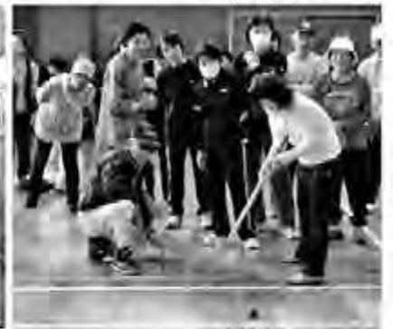
皆さんの熱い視線で 球が燃えてしまいそうです！