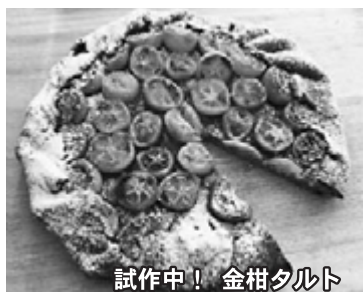
試作中！金柑タルト