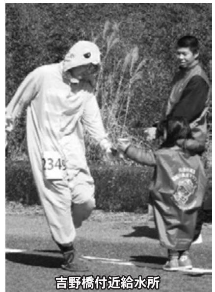
吉野橋付近給水所

「今までは沿道で応援する立場でした。今回初めてランナーとして参加しましたが、実際に走ってみて、こんなに町の人が総出で応援して盛り上げてくれてるんだなあということを改めて感じました。沿道で町内の人達がたくさん応援して下さり、走っている中でとても力になりました。景色も空気も、走りながら堪能し、改めて自分は、恵まれた環境に住んでいるなと思いました。町外の人にとっても海陽町の素晴らしさを知ってもらえる貴重な機会だとおもいました！」