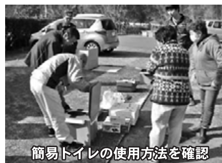
簡易トイレの使用方法を確認