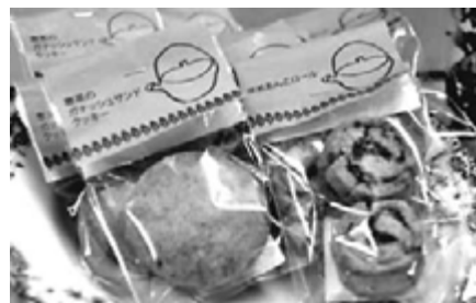
左：寒茶のガナッシュサンドクッキー 右：寒茶あんこロール

その他にも金柑のタルトやにんじんを使ったケーキなど海陽町の季節の食材を使った商品を開発しております。