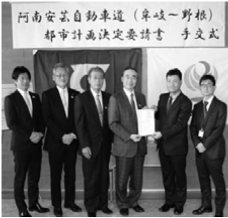
阿南安芸自動車道(牟岐～野根) 都市計画決定要請書 手交式

「海部道路」の新規事業化に向けた最終段階に入ったことは、まことに喜ばしいことであります。国土交通省をはじめ、これまでご尽力いただいた関係者の皆様にご心より感謝申し上げます。今後、徳島県とともに都市計画決定手続きを着実にすすめる、新規事業化まで一層努力するとともに、国に対し「命の道」阿南安芸自動車道の早期整備を強く要望してまいります。