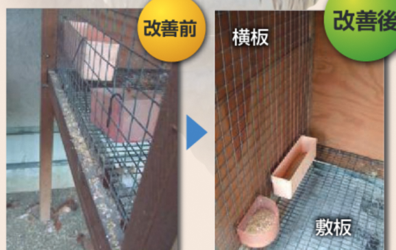
写真3 板を使った餌の散乱防止