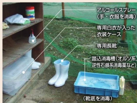
写真4 人を介したウイルス侵入対策