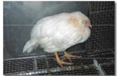
写真2 感染し、元気をなくした鶏