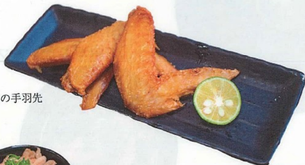
阿波尾鶏の手羽先