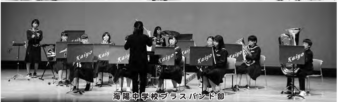
海陽中学校ブラスバンド部