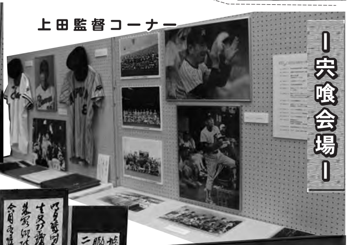
上田監督コーナー