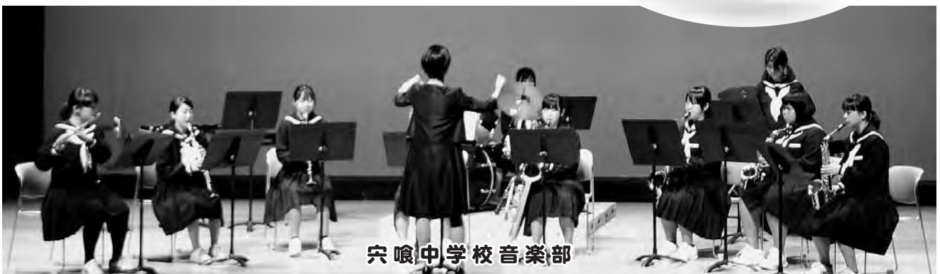
穴喰中学校音楽部