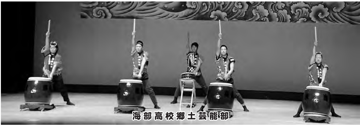
海部高校郷土芸能部