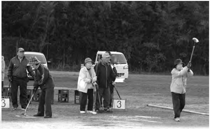
プレーを楽しむ皆さん

11月24日(金)、奥浦町民グラウンドを会場に、海陽町公民館主催のグラウンドゴルフ大会が開催され、83名が参加しました。大会は、個人戦で行われ、総打数を競い合いました。ホールインワン賞は26名の方が受賞されました。