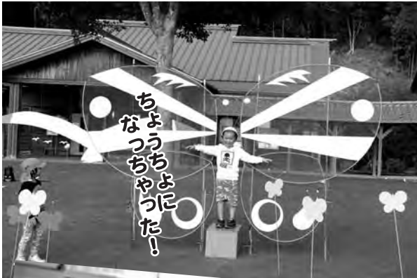
ちようちよに なつちやつた!