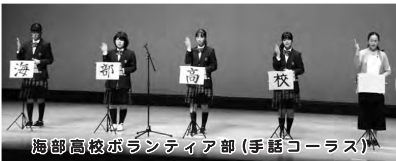
海部高校ボランティア部(手話コーラス)