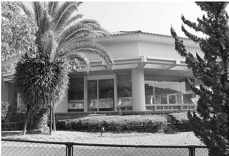
海南B&G海洋センター