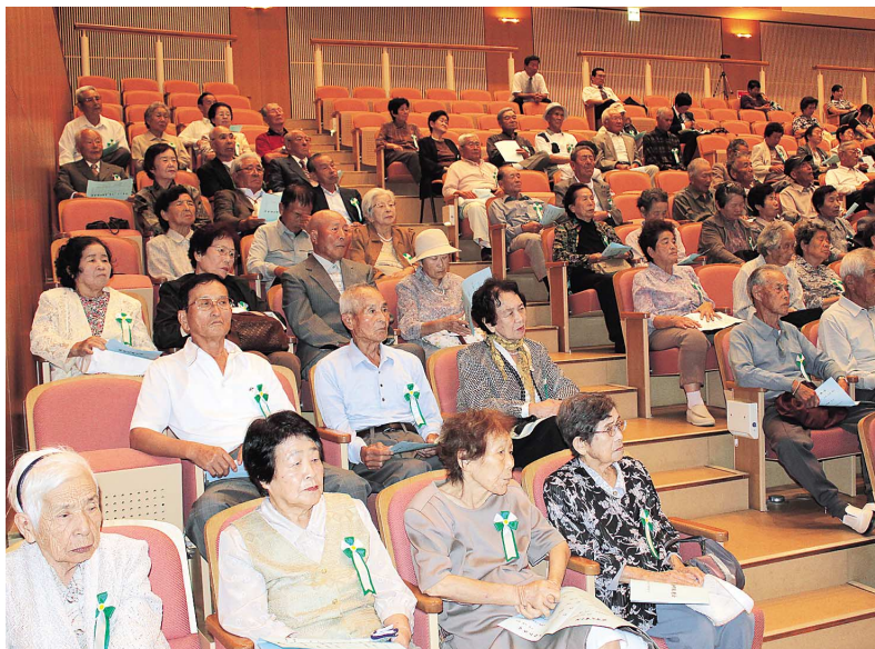
平成21年度 海陽町敬老会