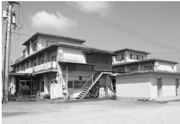
海南中学校友愛寮

変更請負契約について、 1,879万8千円を増 額し、計9,754万8千 円とする説明を受けた。 補正予算では小学校費 の委託料3,352万7