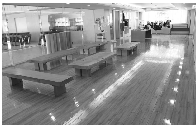
B & G 海南海洋センターロビー

◆歌産業観光課長 健康ジム器具を購入し、体育館に設置予定。インストラクターの指導は経費的に難しいが、水泳を活用した保健指導などを要請中である。