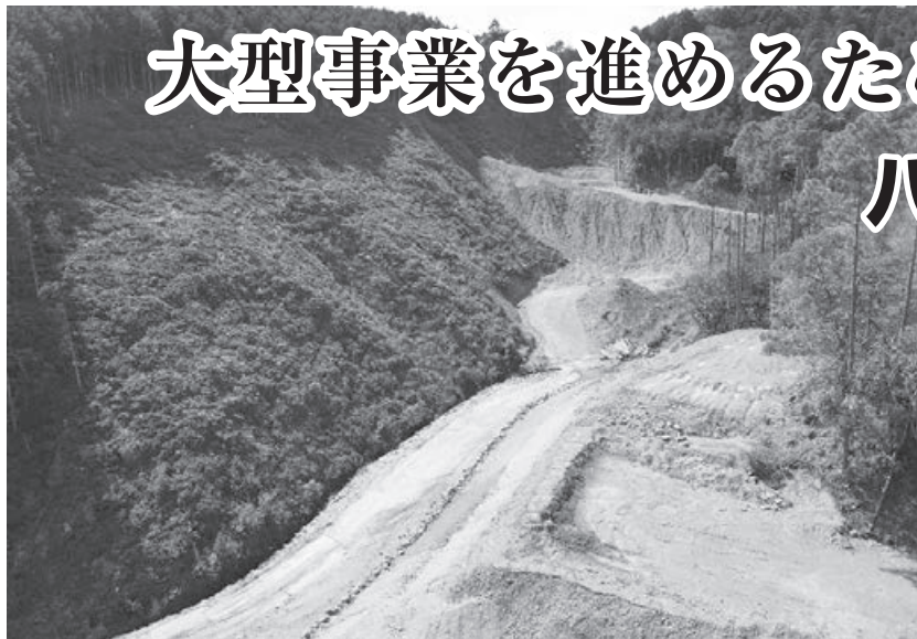
整備される八山残土処分場