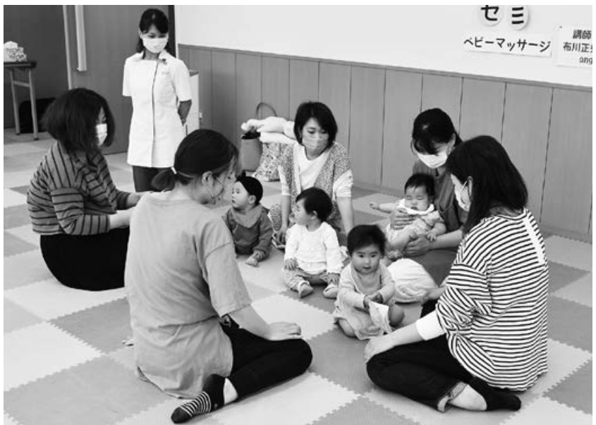
「あのお」で子育ての情報交換