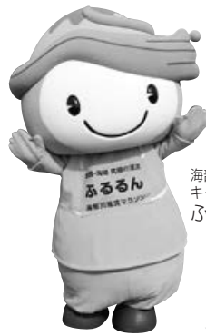
海陽川風流マラソン キャラクター ふるるん