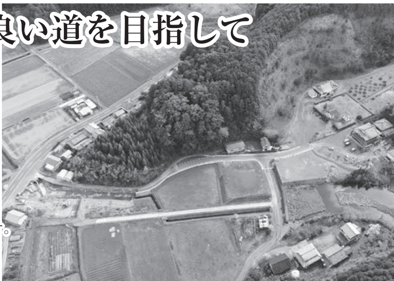
改良工事が続く城満寺線の全景