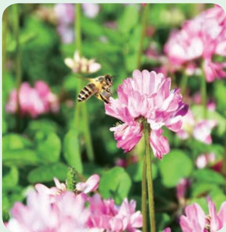
レンゲ草とミツバチ (大里にて)