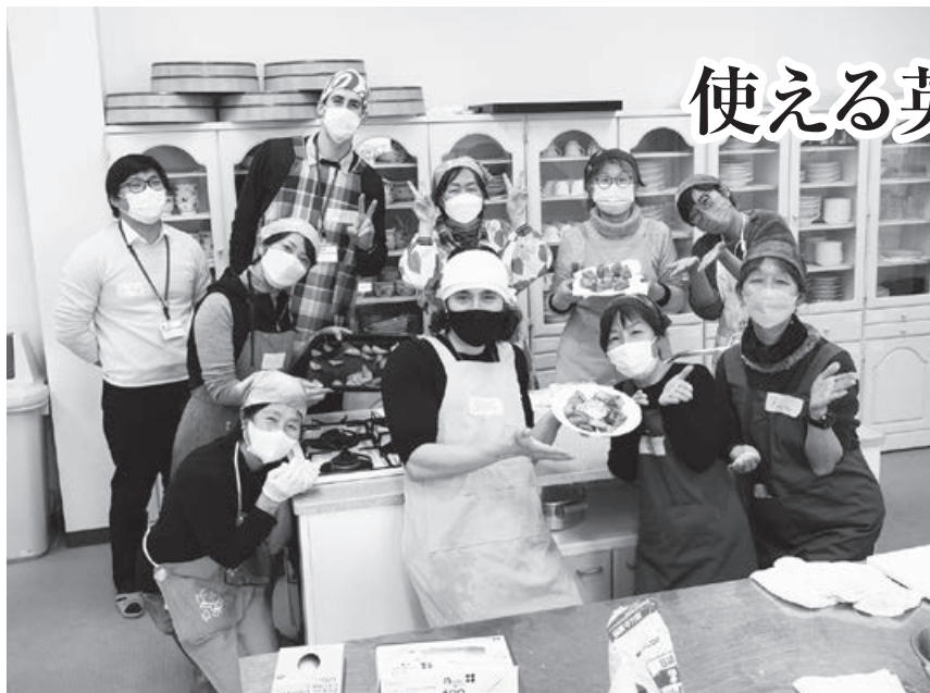
国際交流員(CIR)による「英語おしゃべりクッキング」