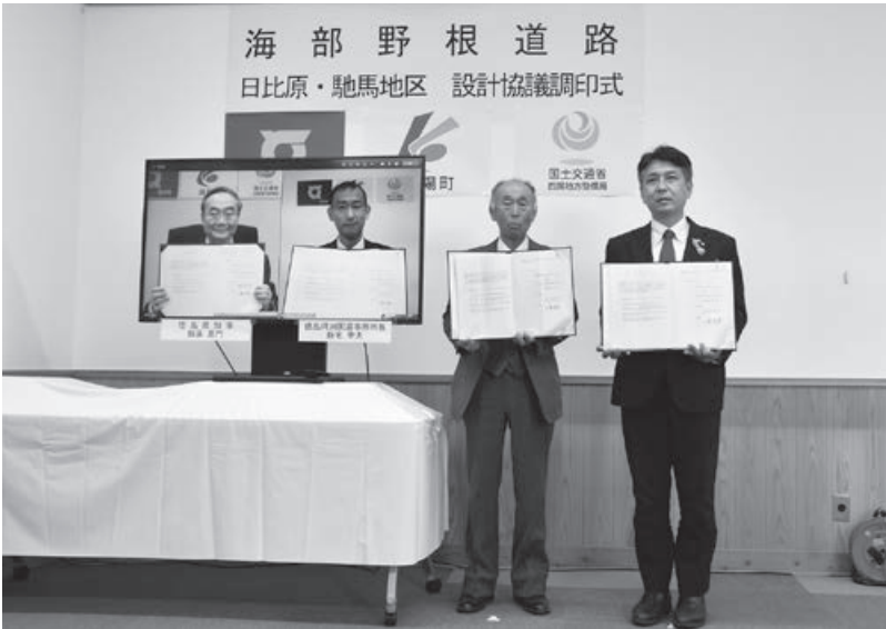
海部野根道路「日比原・馳馬地区 設計協議調印式」 (令和4年2月28日)

岸整備等を進めており、松本排水機場のポンプ能力増強も、調査を行い、事業採択に向け取り組んでいただけることとなつ