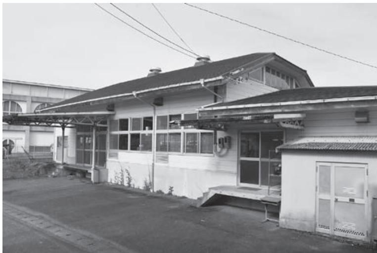
貸し出しが予定されている旧海部学校給食センター（野江）

問 旧海部学校給食センターを町外の民間業者に貸し付ける計画があるようだが、当施設は、立地場所も良く、十分使用できる備品も多くある。町内の方で、弁当の仕出しや、新規参入業者、シカ・イノシシの解体処分の施設として充分機能が果たせ、ジビエ料理として地元の振興を図ってい