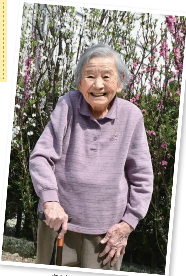
庭の桃の花を背にして (令和4年4月7日)