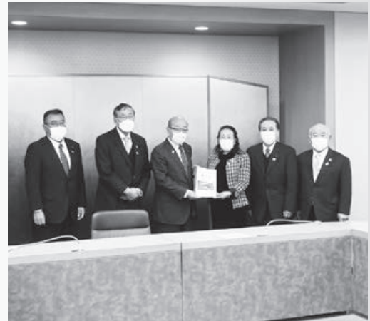
岩丸県議会議長への要望