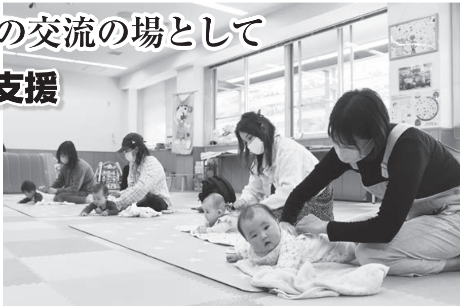
地域子育て支援センター「あのね」ベビーマッサージ講習

海 部庁舎3階の子育て支援センター「あのね」を拠点として、子育て世代の相談や交流の場をつくり、支援を進めます。