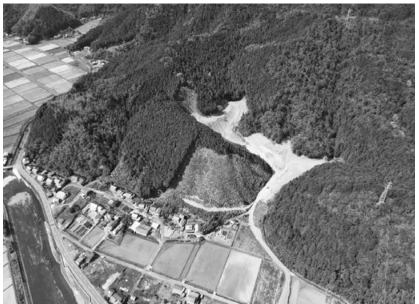
空から見た八山残土処分場の周辺