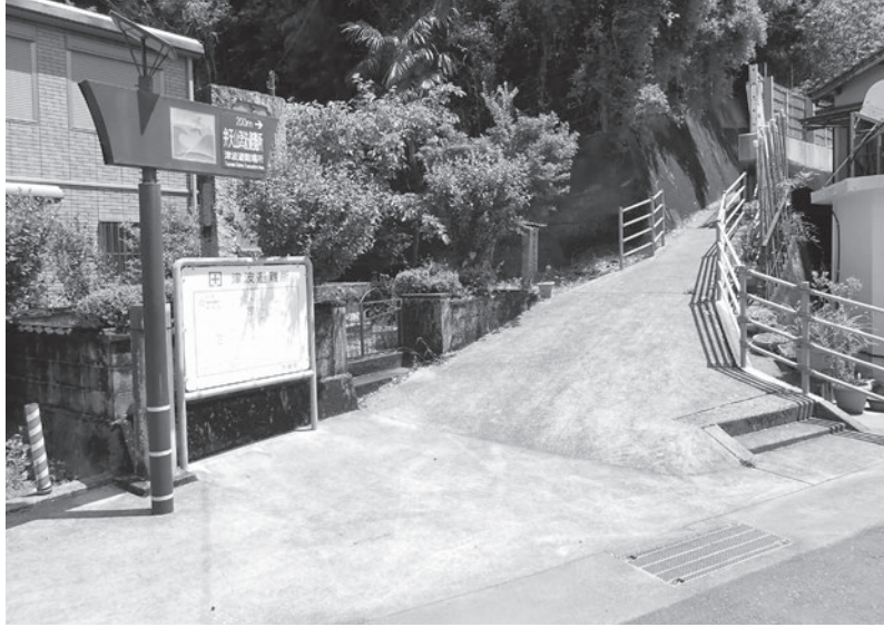
突喰弁天山避難路入口