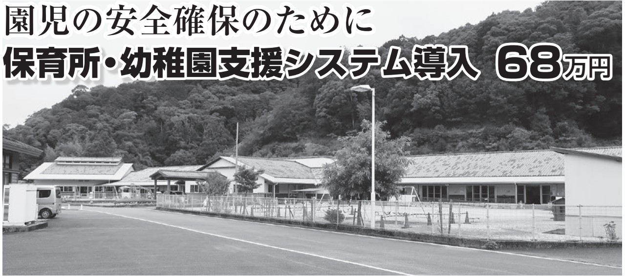
海南保育所・海陽幼稚園の全景

業 務のICT化を進めることにより、園児の安全確保及び保護者にとっての利便性向上や、多様化する教諭・保育士の業務量軽減と働きやすい職場づくりなどのメリットが期待できます。