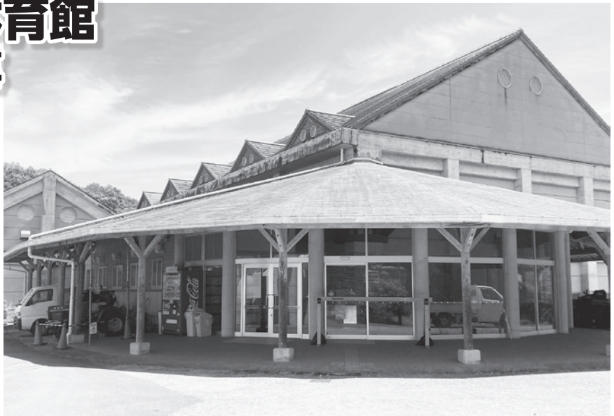
改修前のまぜのおか体育館の屋根