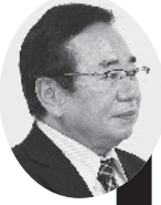
高島 孝人 議員

この事業の目的は町産材の活用であるが、木材の備蓄が少ないので、一定数量の確保はできないのか。これからは、住宅建設の件数も減ってくるので、住宅以外にも町産材を使えるようにしてはどうか。