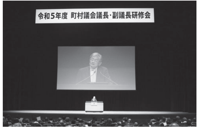
3名の講師による講演