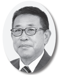
長江 範裕 議員