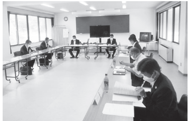
海部郡衛生処理事務組合第1回臨時議会