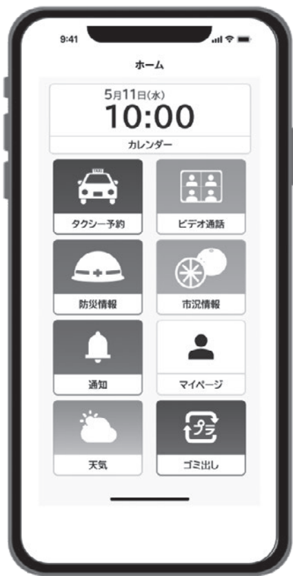
行政情報アプリホーム画面イメージ

導入を検討している。今後、防災無線の改修時期に合わせて、防災無線の内容を、音声情報と文字情報で配信を行い、住民の方が、確実に防災無線情報を取得でき、また、リアルタイムな情報を瞬時にアクセスできるように考えている。その他、広報誌の内容など、町の情報を一括して入手できるように、住民の安心安全の確保並びに住民サービスの向上のため、取り組んでいきたい。アプリの開設は、防災無線が竣工するまでに導入を考えていきたい。