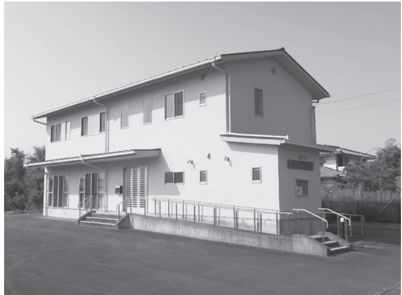
浜崎地区集会所兼避難所

浜崎地域は、国の津波シミュレーションをもとに設定した徳島県津波浸水想定で、浸水区域外となっており、高台等の避難場所はない。発災時に