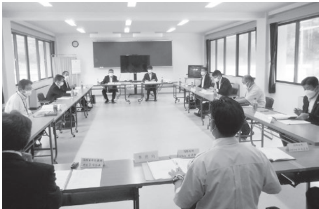
海部消防組合第1回臨時議会