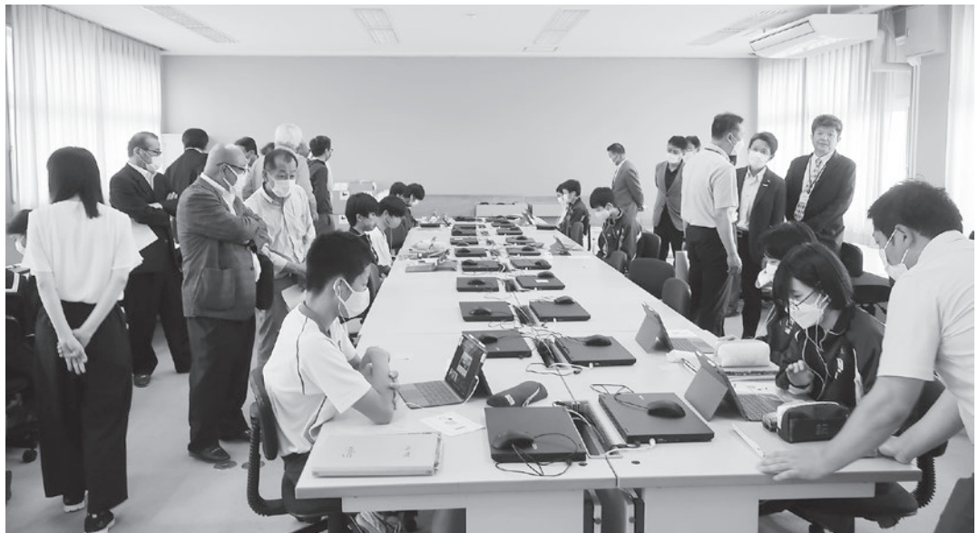
タブレットを活用した英会話授業を巡視（海陽中学校）