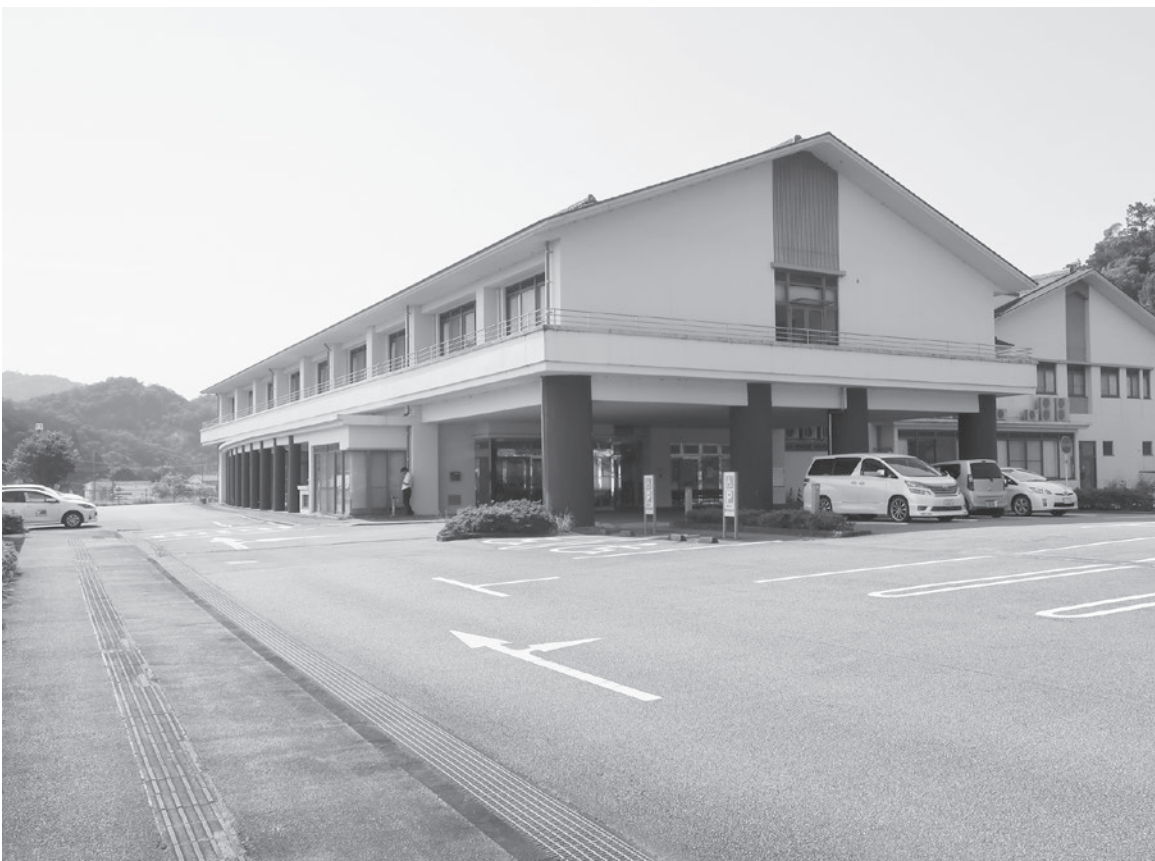
経営改善を行っている海南病院