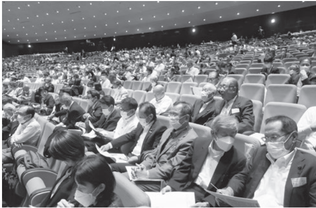
研修を受講する海部郡議長・副議長