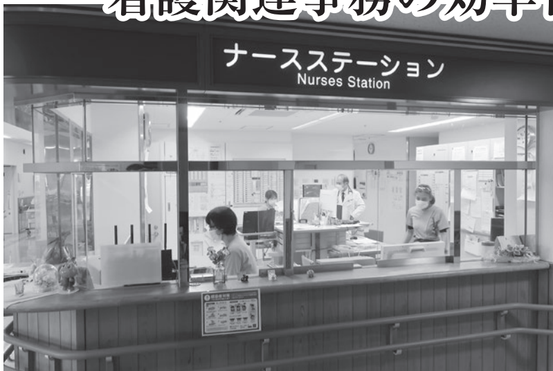
海南病院ナースステーションの様子