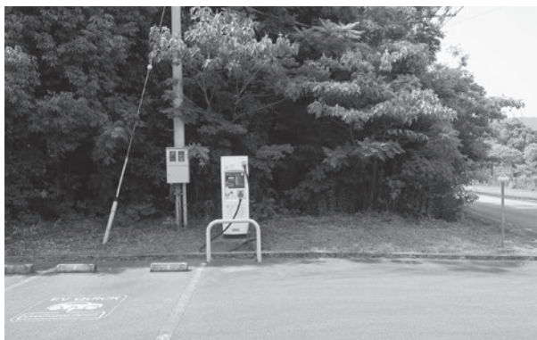
すでに整備されているEV充電ポイント(電気自動車の充電場所)