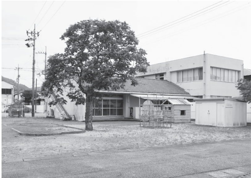
突喰ドリーム館の全景

問 海陽町の突喰庁舎は緊急避難場所になっていない。付近には突喰小学校があり、突喰保育所の園児48名が通園している。