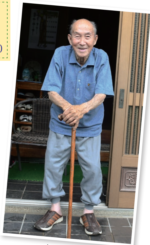
自宅玄関前にて (令和5年6月30日)