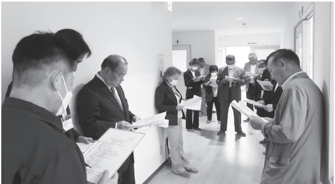
完成後の中里農業構造改善センターを巡視