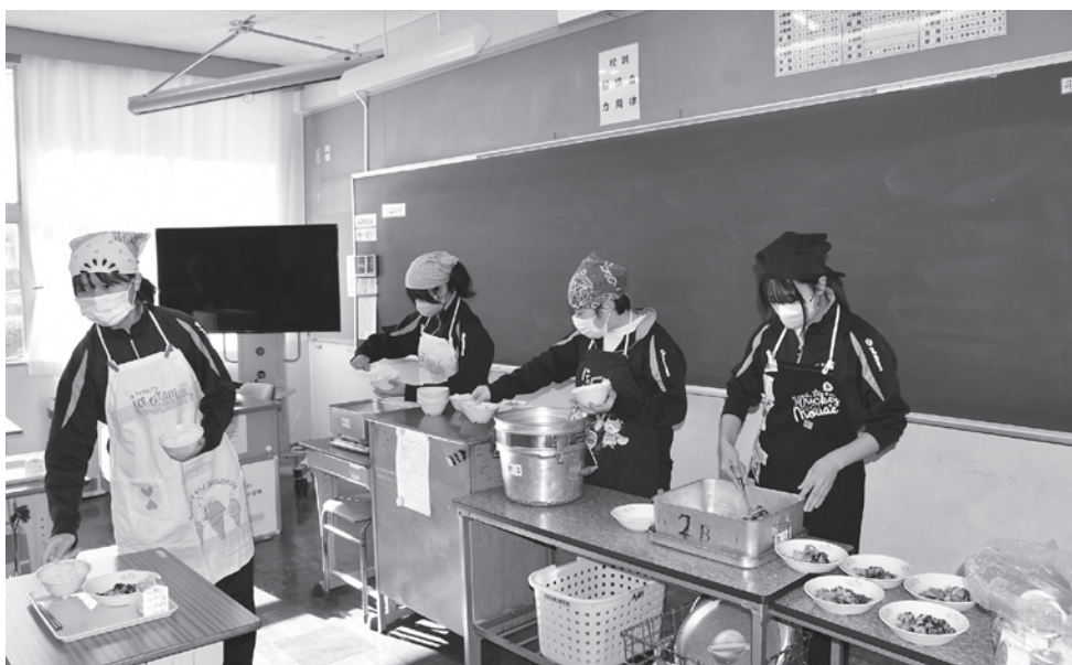
給食準備の様子(宍喰中学校2年生)

答 森崎教育次長 限られた財源の中で、ICT教育やグローバル教育の充実、学校施設の安全確保など、子どもたちの教育環境を整えていくという喫緊の課題がある。これらを優先すべきと考えている。