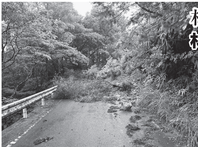
林道神野内妻線の災害状況