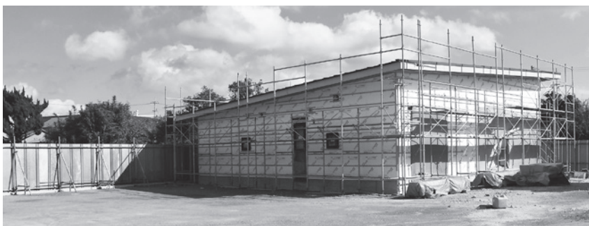
高校生の居場所新築工事

300万円、電気使用料150万円の追加。 要望 人件費が経営を圧迫しているため、早く常勤医師を確保して、人件費を抑制できるよう努力してほしい。