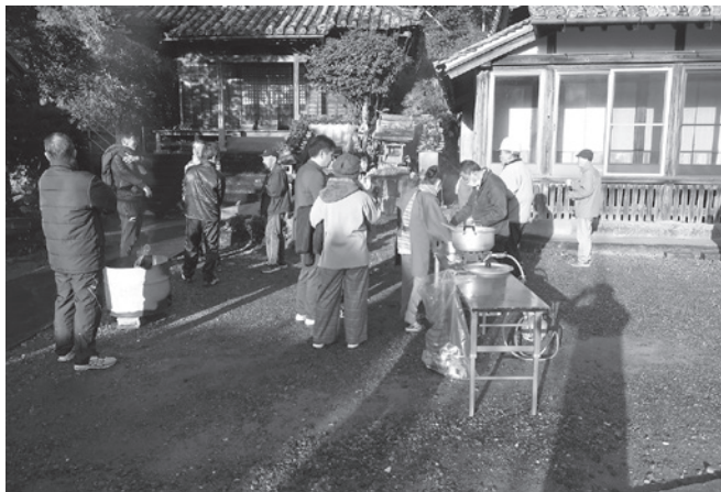
防災訓練（奥浦薬師寺）

より合格を条件として、防災士の資格取得の際に、教本の代金、受験料、登録料を上限1万2000円の補助をしている。今年の申請者は4人。発災時には行政が行えることは限られている。避難所運営を含め、住民の方々の自助・共助が非常に重要である。このことを含め、住民の方々へ周知し、防災意識の向上へ努めてまいりたい。