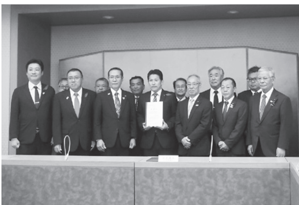
須見県議会議長への要望