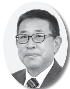
長江 範裕 議員