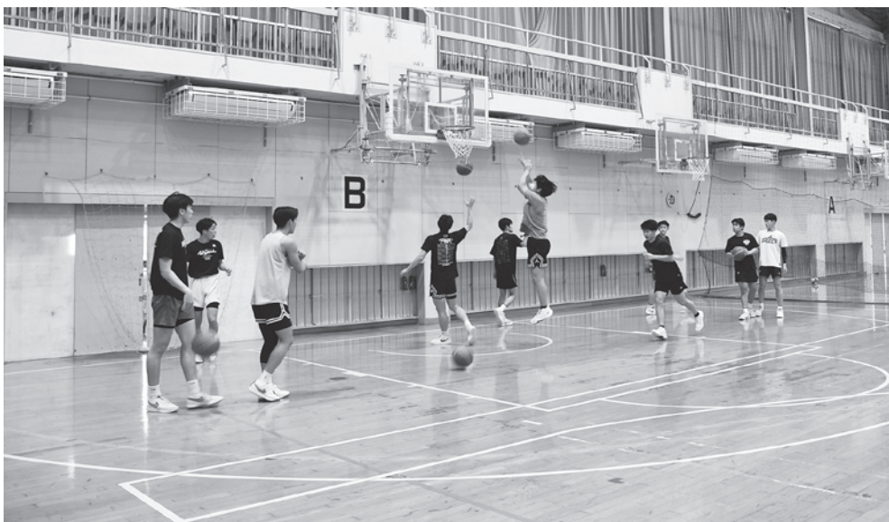
海部高等学校バスケット部の練習

続きとなっているが、保護者の負担軽減を図るため、オンライン申請を含め、今後、研究をしてまいりたい。