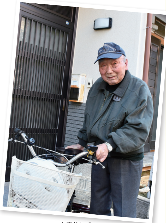
自宅前にて (令和8年1月17日)