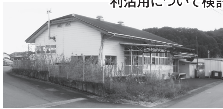
未活用の旧海部給食センター

問 公有財産の未活用の状況と利用実績はどうなっているのか。また、今後の活用について検討しているのか。