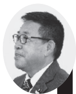
長江議員 境界明確化事業の 進捗率は。