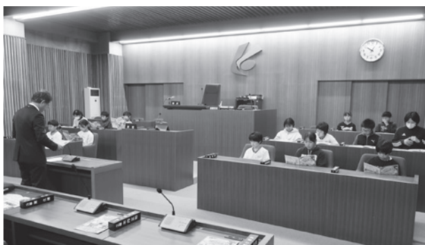
議会の仕組みについて説明を受ける様子

海南小学校6年生が総合学習(防災学習をテーマ)で取り組んできた成果をまとめ、児童たちの思いや学んだことを、ぜひ議員の皆さまに発表したいとの強い要望により、防災学習発表会が開催されました。