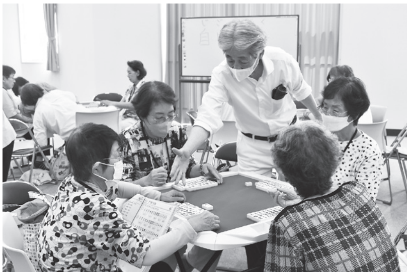
指導を受ける健康マーじゃんの参加者

サ ードプレイス♡かいよう健康マーじゃん教室では、「賭けない・飲まない・吸わない」をルールに、脳の活性化や交流を目的とした健康マーじゃん教室に取り組んでいます。