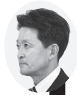
小山議員 5路線の維持 補修とのことで あるが、他にも

修繕しなければならない箇所が多くある。橋梁などの長寿命化のように、計画を立てて、工事を進めているのか。