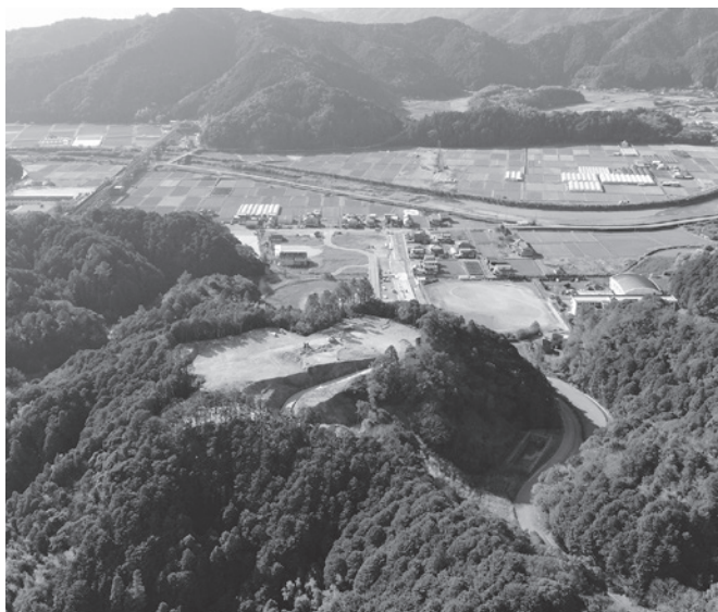
宍喰地区地域防災公園