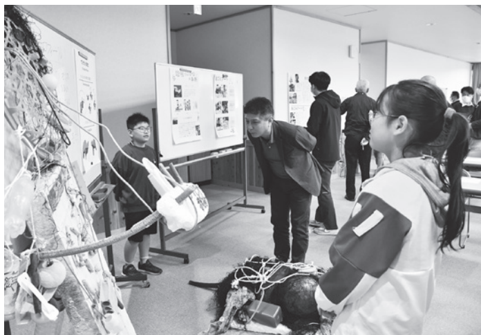
総合学習発表会でウミガメの魅力について説明する 海南小学校4年生（令和7年12月2日）

通学できるような地盤を早急に構築していきたい。地方の力の弱まりが懸念されている。海陽町も、常に新しいことに挑戦し、動いていかなければならない。失敗を恐れず、常に挑戦をし、キラリと光る便利で都会的な田舎、そしてワクワクする田舎を目指していく。