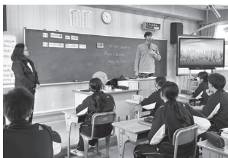
グローバル教育授業(海陽中学校)

現在の配置状況と活用実態を丁寧に把握した上で、配置数や時間の調整もしていきたい。また町長部局と連携をしながら、国や県の補助制度の活用も含めた財政的な手当てについても研究し、海陽町の当たり前としてグローバル教育を定着させていきたい。