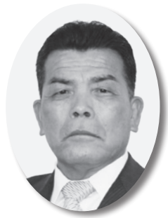
富田 寛 議員