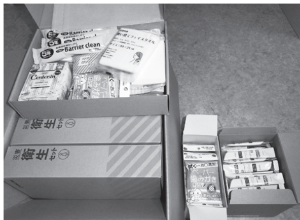
口腔ケア用品の備蓄状況

答 奥原建設防災課長 昨年度であるが、子どもあゆみ保健課の方で各庁舎へペーパー歯磨きや液体歯みがきの配備をした。今後も口腔ケアの重要性を周知、啓発していく。