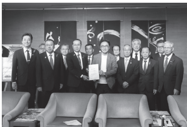
後藤田県知事への要望