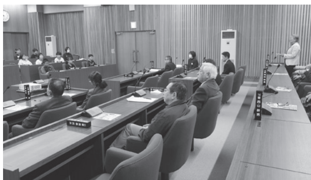
各議員との意見交換